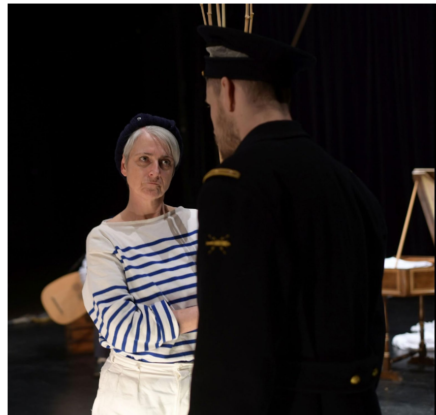
Photos prises lors de la résidence de création – Chapiteau de La Seyne-sur-Mer (Mars 2021)