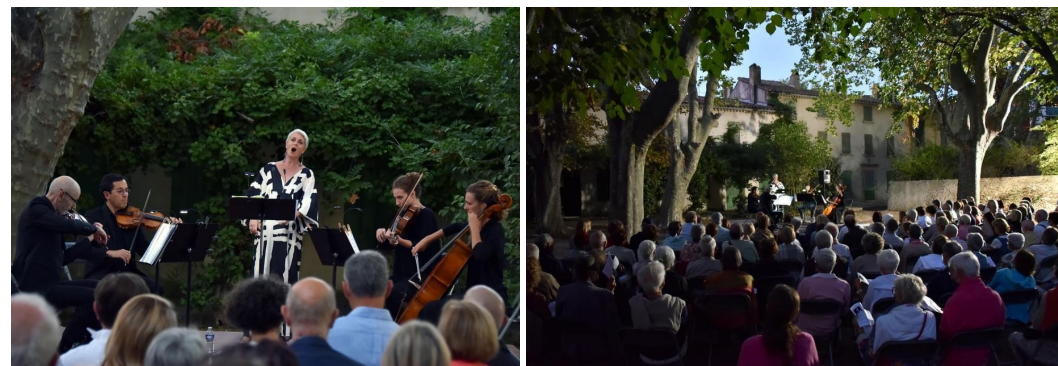
Programme « Nuits d'été » avec le Quatuor Andrea / Villa Simone à Six-Fours-les-Plages