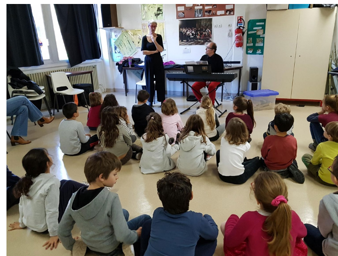
Action de médiation. Ecole Philippe Rocchi, Le Revest-les-Eaux